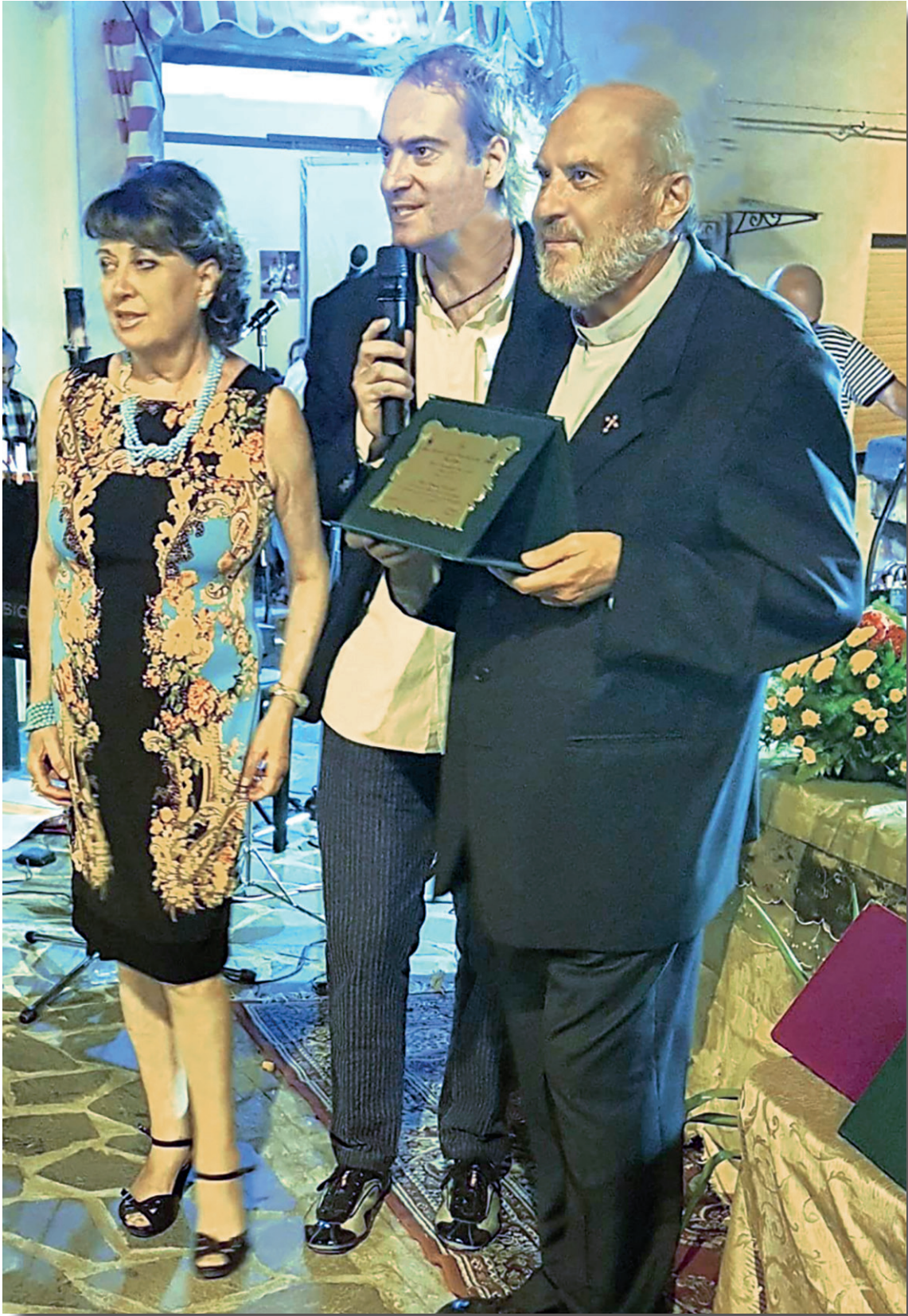
Premio Edward Lear a Montebello Jonico, 11 agosto 2017