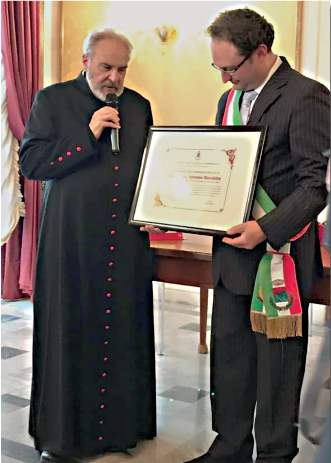
Conferimento della Cittadinanza Onoraria del Comune di S. Alessio in Aspromonte